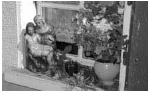
Fronleichnam 2004 in Triesen

Der Priester feierte die Messe nicht mehr dem Volk zugewandt. Um dieselbe Zeit begann man, bei der Wandlung trotz heftigem Widerstand der kirchlichen Obrigkeit Hostie und Kelch emporzuheben. Der Kommunionempfang war so sehr zum Ausnahmefall geworden, dass das Vierte Laterankonzil im Jahre 1215 die so genannte «Osterkommunion» als Kirchengebot vorschreiben musste. Die Kommunion wurde nicht mehr auf die Hand, sondern in den Mund gespendet, ohne dass es je vorgeschrieben wurde.