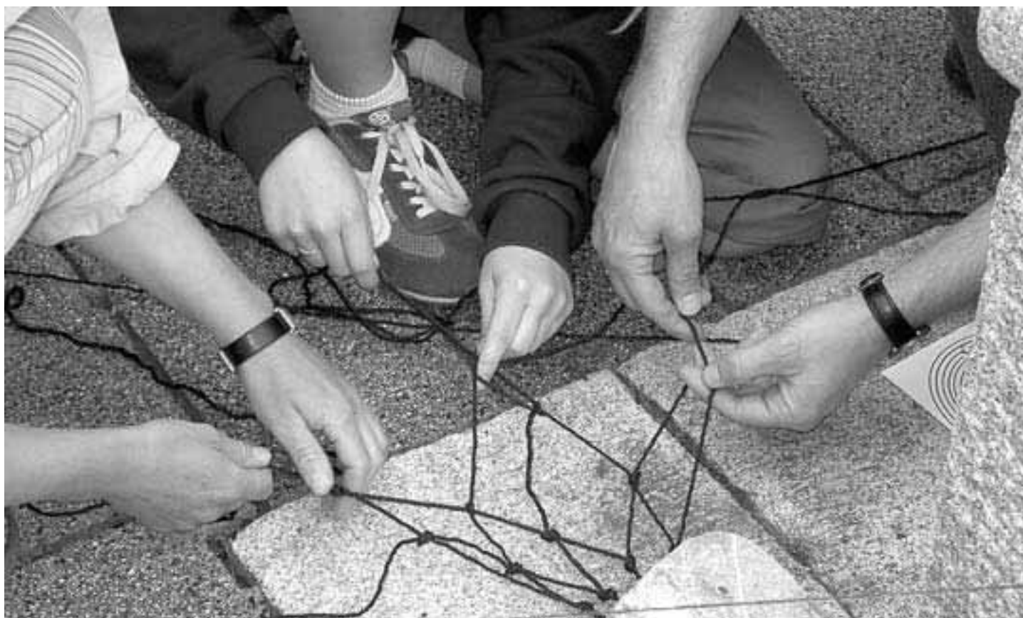
Am Gemeinschaftsnetz knüpfen.