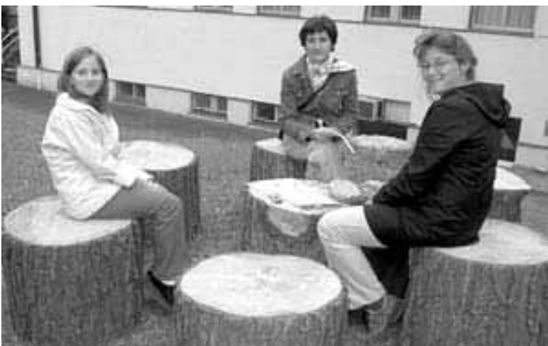
Gemeinsam über das Leben nachdenken.

Der erste Schritt zur Umkehr ist die Einsicht: Ich habe einen Fehler gemacht, ich bin schuldig geworden. Wie schwer es ist Theoretisches in Praktisches umzusetzen zeigt sich am Abend: Zwei Firmlinge geraten in Streit, es gibt verschiedene Meinungen wie es dazu gekommen ist. Halbpatzig kommt nach der Aussprache eine «Entschuldigung» über die Lippen, mehr um eines faulen Friedens willen als aus Schuldeinsicht. Hier sind Kinder nur allzu oft Spiegelbild unseres erwachsenen Verhaltens. Oder wie gehen Sie mit Konflikten um und welche Zeichen der Versöhnung im Alltag setzen Sie?