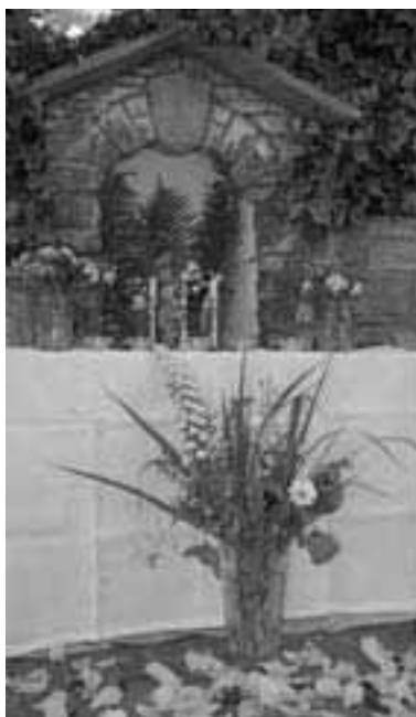
Fronleichnamsaltare in Triesen.

«Seid, was ihr seht, und empfangt, was ihr seid: Empfangt den Leib Christi, seid der Leib Christi.»