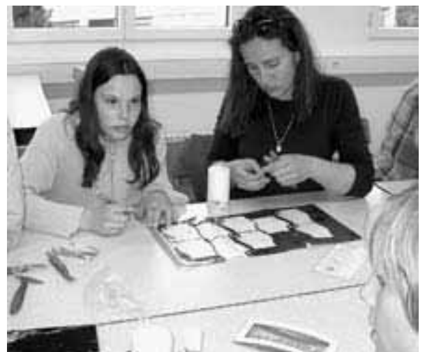
Eine Versöhnungskerze gestalten.