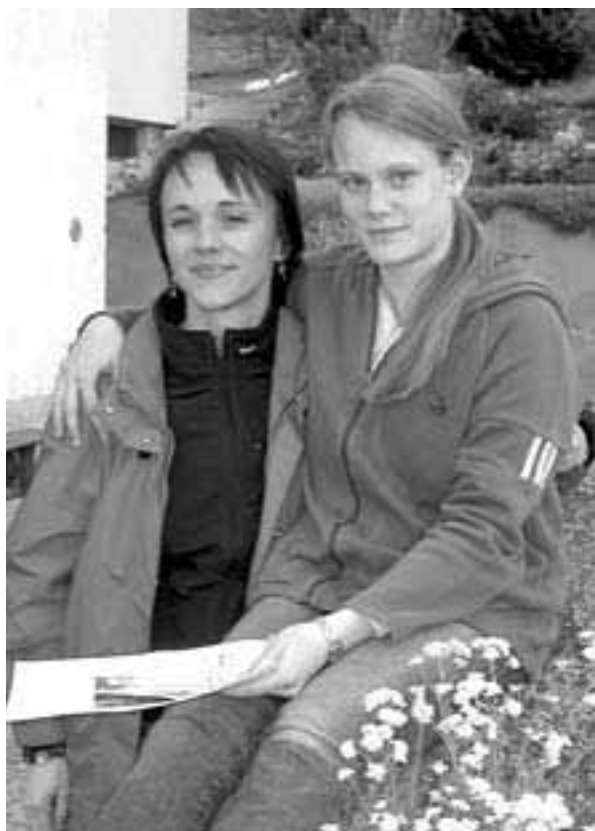
Die Firmpatin: Eine gute Freundin.