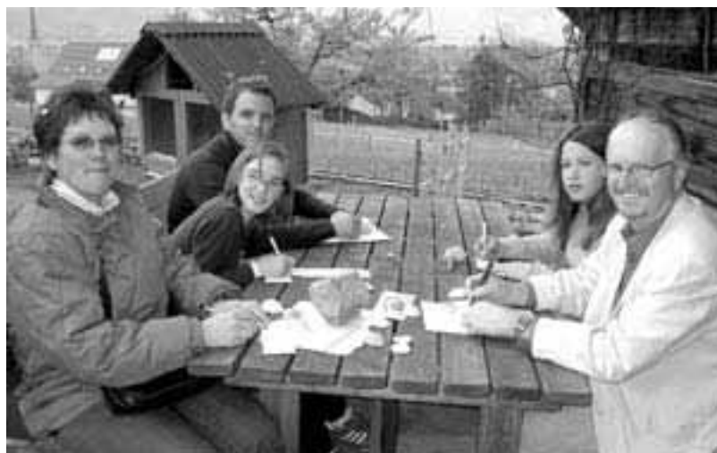
Station «Schöpfung»: Was tragen wir zur Bewahrung bei?