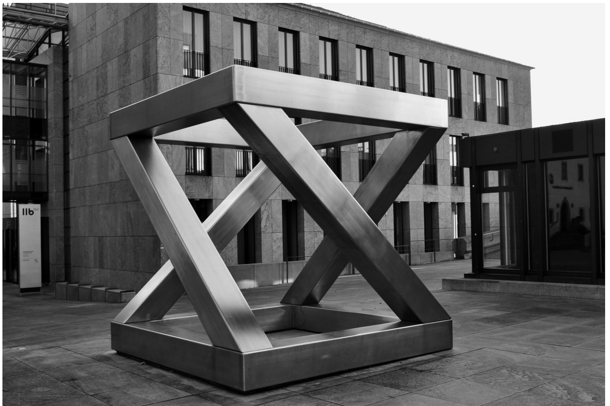
Malin Z-Würfel, Vaduz