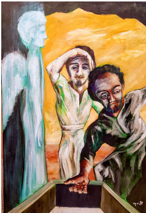
Erich Guntli, Petrus und Johannes am Grab

Gemäss Statistiken sei dieser Glaube bei ca. 90 % der Gläubigen in den Freikirchen unumstösslich, bei den Katholiken