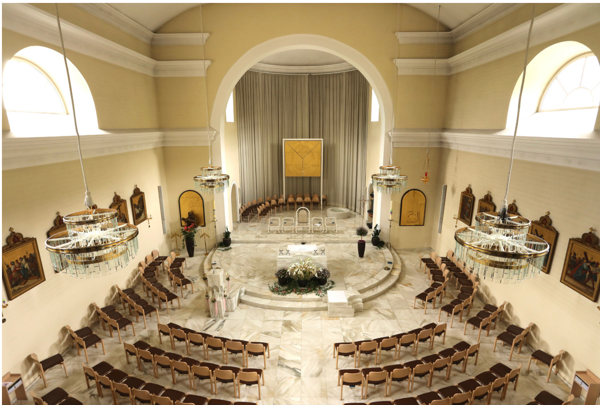
Pfarrkirche Mauren, renoviert nach Entwürfen von Georg Malin in den Jahren 1986 bis 1988